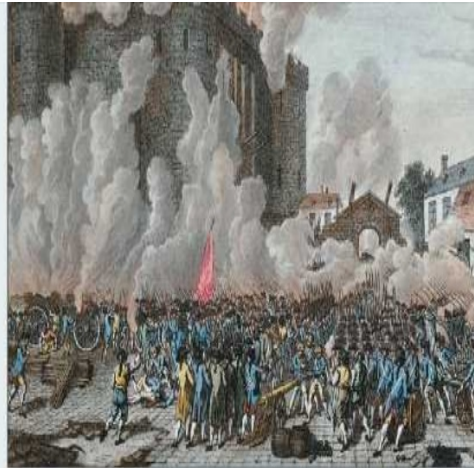
La prise de la Bastille

L a Révolution est probablement la période la plus importante de l'histoire de France. Elle met fin o à l'Ancien Régime* et à ses abus. Elle établit les bases d'un gouvernement démocratique en affirmant l'égalité de tous les citoyens. o Ce fut pendant la Révolution que furent proclamés la République, l'abolition de l'esclavage o et les droits o de l'homme et du citoyen. La Révolution française fut aussi marquée par un énorme effort de centralisation qui unifia la France en donnant un certain nombre d'institutions communes au pays. La plupart de ces institutions subsistent aujourd'hui. Voici quelques institutions françaises qui remontent o à la Révolution.